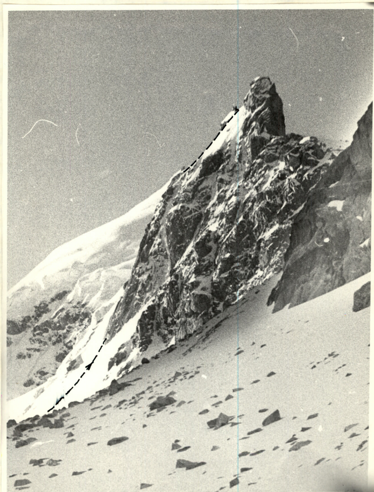
Фомо N2. Буд в прогнел.