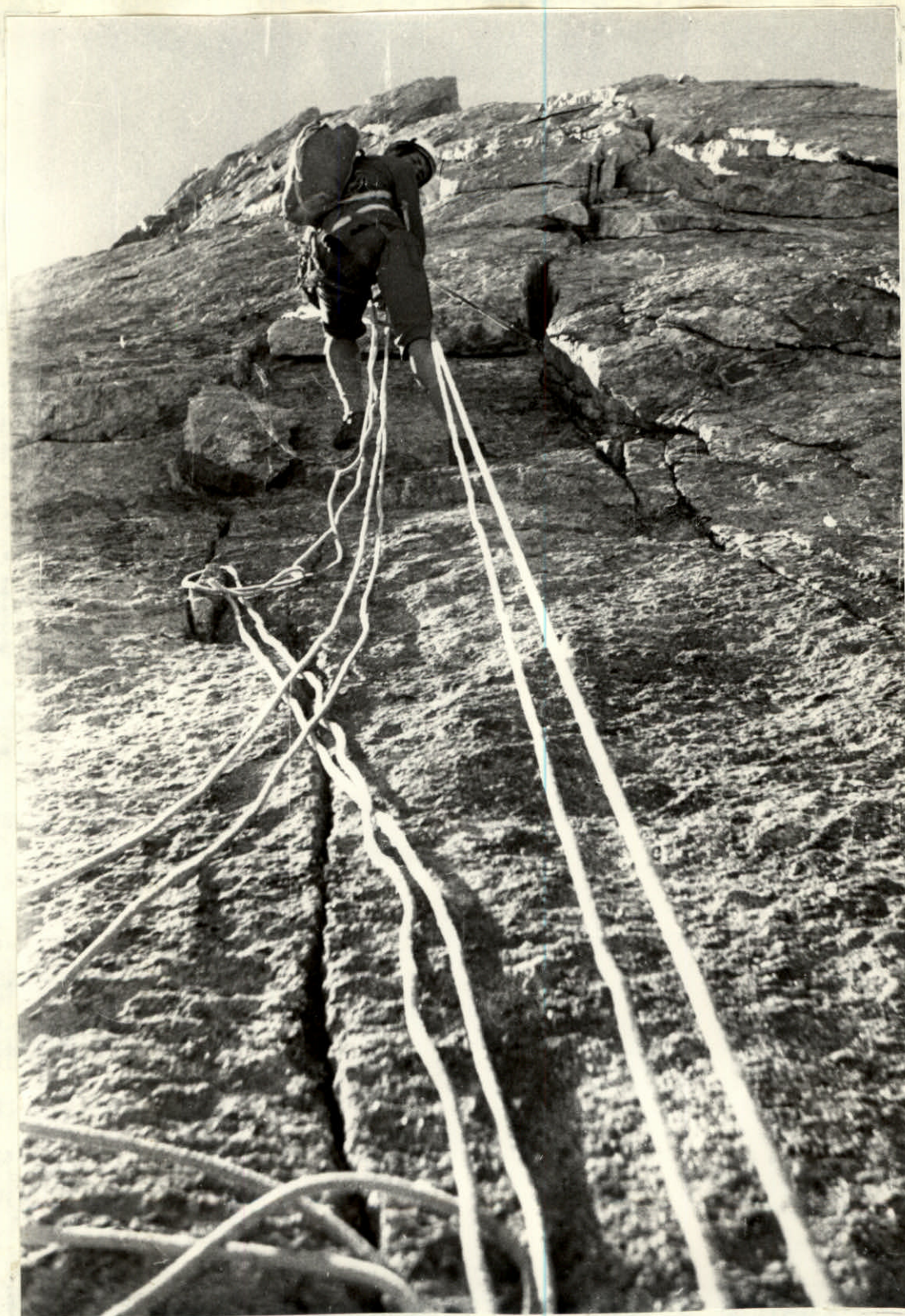
Фото №4 „... Здесь организуется полувисячий пункт страховки.“