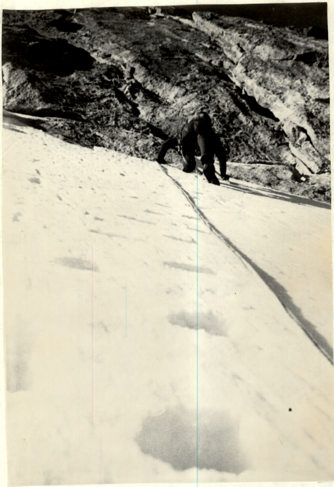
Фото №3 „... по ледовому склону под основанием контрфорса в направлении двух внутренних углов...”